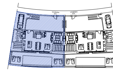
SITUACION POR BLOQUE